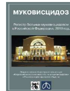
«Регистр больных муковисцидозом в Российской Федерации» за 2019 г. (2021)