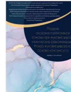
«Модели оказания паллиативной помощи при муковисцидозе» (2021)