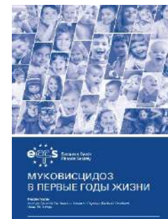
«Муковисцидоз в первые годы жизни» (2021)